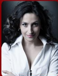
Solist Esra ÇETİNER (Soprano)